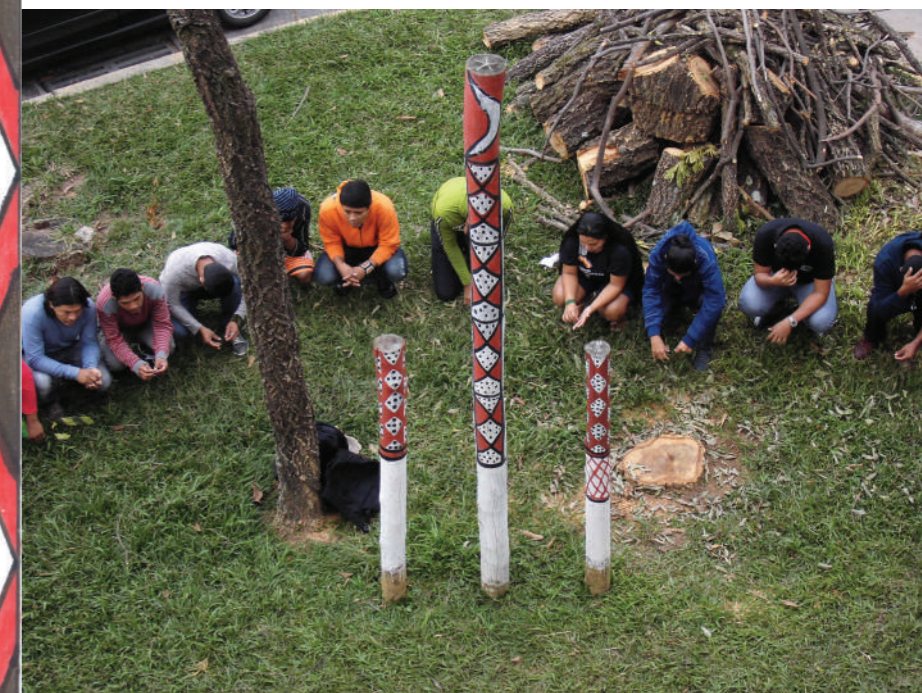
Mimãnm - Espaço de fortalecimento cultural dos estudantes indígenas na FAE

Ôté omhá, Atxôhã, Mrmezé, Nhemombe'ú, Meang'gã